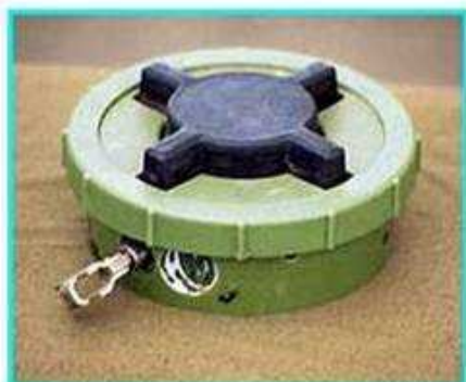
Рис.1 Общий вид мины ПМН-2

ПМН-2 Противопехотная мина нажимного типа